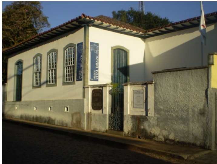
Casa Vital Brazil - Campanha - MG

Dentro da programação oficial da reunião da SBPC, no dia 9, das 10h às 12h, haverá mesa redonda comandada pelo biólogo Aníbal Melgarejo, Pesquisador e chefe da Divisão de Zoologia Médica do Instituto Vital Brazil.