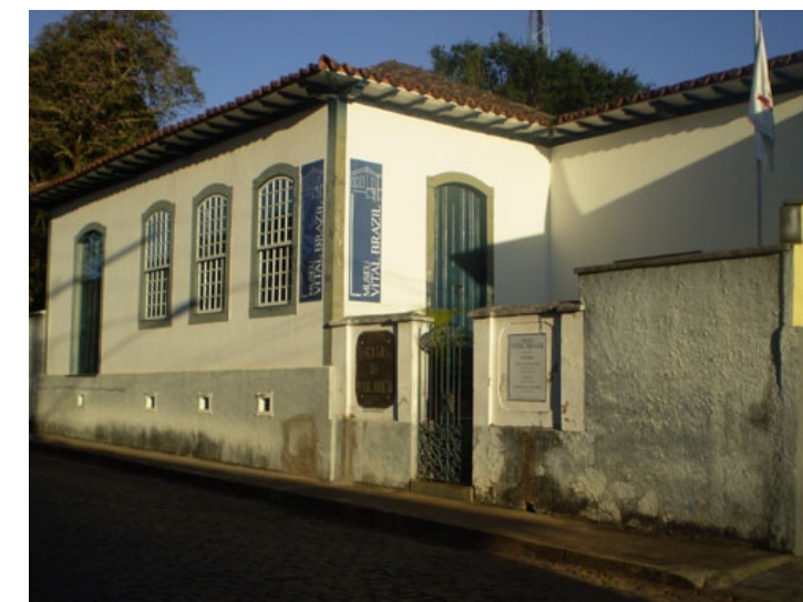
Casa Vital Brazil - Campanha - MG

Dentro da programação oficial da reunião da SBPC, no dia 9, das 10h às 12h, haverá mesa redonda comandada pelo biólogo Aníbal Melgarejo, Pesquisador e chefe da Divisão de Zoologia Médica do Instituto Vital Brazil.